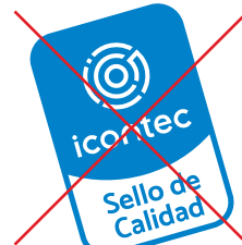
No reproducir el logotipo inclinado