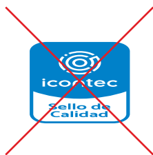
No cambiar las proporciones y no distorsionar

Referencial y nombre de producto, o alcance del proceso ó servicio.