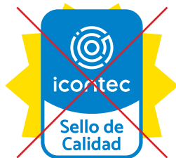
No invadir el fondo con elementos gráficos