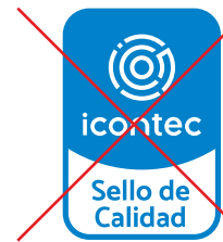
No ubicar el referencial verticalmente

Referencial y nombre de producto, o alcance del proceso ó servicio.