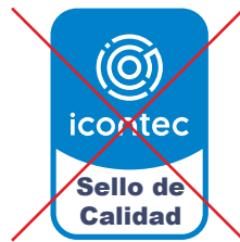
No alterar la tipografía