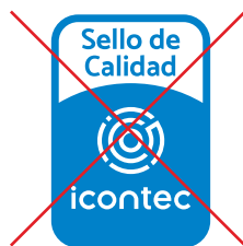
No alterar el orden de los elementos