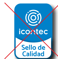
No aplicar sombreado o efectos gráficos