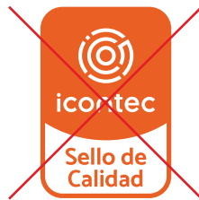
No alterar el color