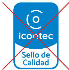
No eliminar elementos