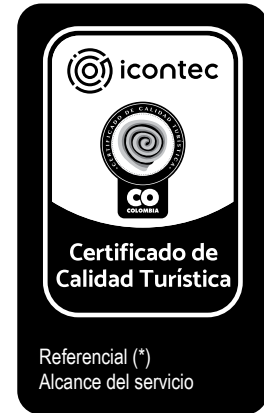
Referencial (*) Alcance del servicio

El logotipo puede ser usado en versión positivo y negativo. La versión negativa solo puede ser aplicada sobre un fondo de color Pantone Process Blue. Si el fondo no tiene esa configuración de color es mejor abstenerse de usar esta versión para no incurrir en un uso indebido.