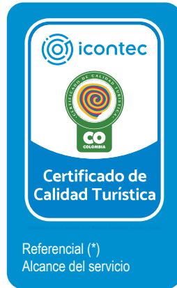
Referencial (*) Alcance del servicio