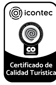
Referencial (*) Alcance del servicio